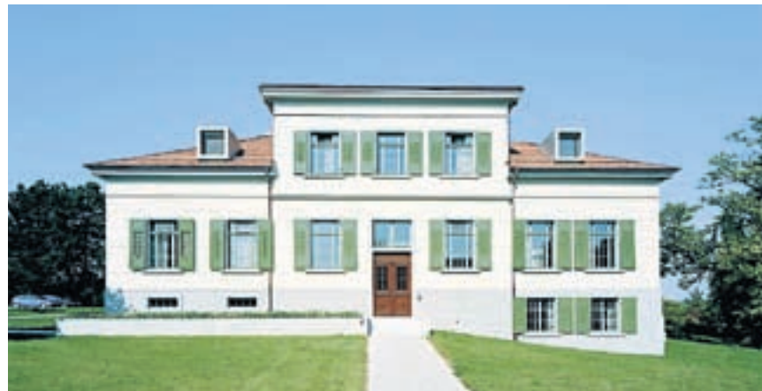
Trotz Verdichtung: Die Räumlichkeiten des Haus F der Psychiatrischen Klinik Münsterlingen haben nach dem Umbau ihre Qualitäten bewahrt.

Schlafsaal – gliedert den Grundriss des Piano Nobile, flankiert von zwei seitlichen Zimmerschichten.